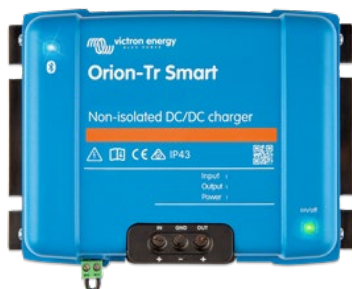
Orion-Tr Smart non isolé 12/12-30