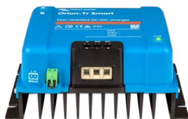
Orion-Tr Smart non isolé 12/12-30