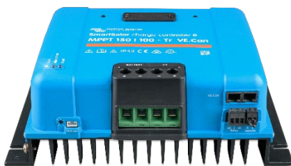
Contrôleur de charge SmartSolar MPPT 150/100-Tr VE.Can sans écran