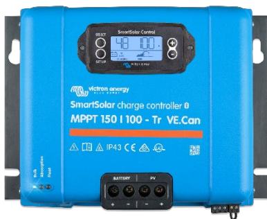
Contrôleur de charge SmartSolar MPPT 150/100-Tr VE.Can avec écran à brancher en option