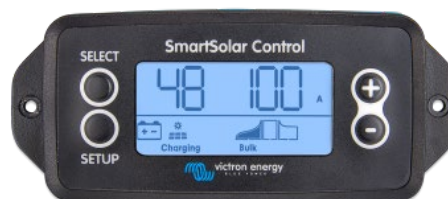
Écran à brancher SmartSolar