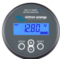
Détection Bluetooth : Contrôleur de batterie BMV-712 Smart