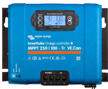
Contrôleur de charge SmartSolar MPPT 250/100-Tr VE.Can avec écran à brancher en option