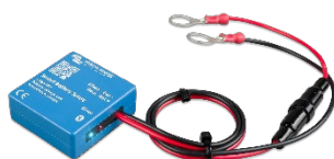
Détection Bluetooth : Sonde Smart Battery Sense