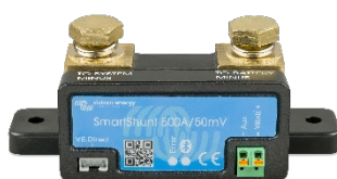
Bluetooth sensing: SmartShunt