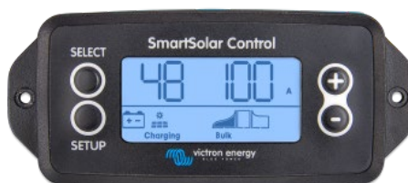
Écran à brancher SmartSolar