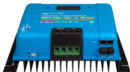
Contrôleur de charge SmartSolar MPPT 250/100-Tr VE.Can sans écran